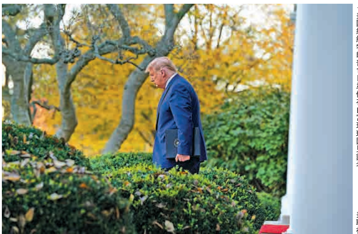
▲美國總統特朗普13日準備在白宮玫瑰園見記者

儘管華盛頓特區警方和美國國家公園管理局都沒有向示威活動發放許可，包括極右翼團體「驕傲男孩」在內的數個組織14日舉行「讓美國再次偉大百萬大遊行」和「停止偷竊」等多場集會。與此同時，反種族歧視團體也在附近舉行「黑人的命也是命」遊行。雙方一度爆發爭吵，但暫未發生大規模的暴力事件。