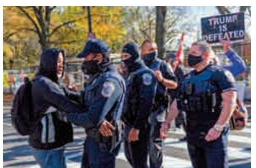
▲華盛頓特區警方13日與「黑人的命也是命」示威者發生衝突

自從美媒7日預測拜登獲得跨過勝選門檻的270張選舉票後，特朗普一連五日都保持沉默。他13日在白宮玫瑰園首次發表公眾講話，談到疫情時稱：「誰知道下屆政府會怎樣？我相信時間會證明，但我可以告訴大家，現屆政府不會再度「封城」。他沒有回答記者提問，雖然仍未承認落敗，亦無提到拜登的名字，但美媒分析，他的這一言論可能是暗示自己未能連任。