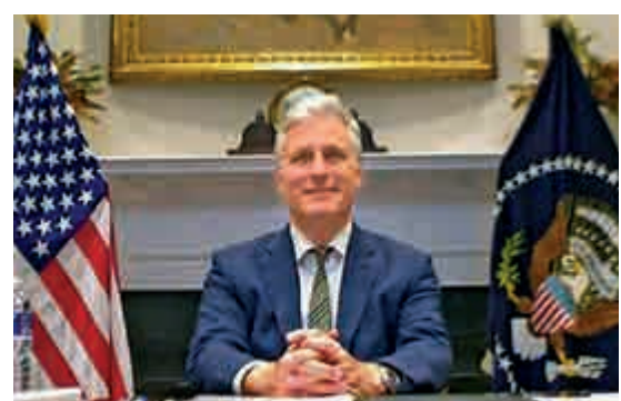
▲美國國家安全事務助理奧布萊恩13日出席東盟峰會的視像會議

據悉，奧布萊恩15日還將出席東亞峰會，預計屆時中、日、韓、澳、新西蘭及東盟共15個國家，將簽署《區域全面經濟夥伴協定》(RCEP)」，預計成為全球最大規模的自由貿易協定。另外，白宮仍未宣布美方由誰代表出席20日在線上舉行的亞太經合組織(APEC)領導人非正式峰會。