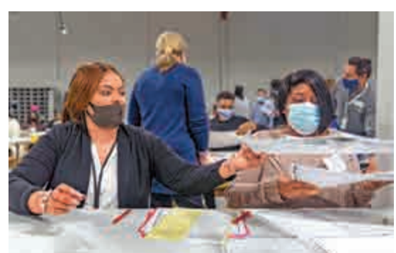
▲佐治亞州計票工作人員13日重新手動點票

在賓夕法尼亞州，特朗普陣營要求法院不要計算在11月3日後送抵點票中心的9300張選票，但法官認為受疫情影響，郵寄投票過程面臨「前所未有的挑戰」，維持當地在大選後三日送達的郵寄選票亦為有效選票的裁決。另外，大型律師事務所Porter Wright Morris & Arthur因協助特朗普打官司而遭受抨擊，決定退出阻止賓夕法尼亞州確認選舉結果的訴訟。