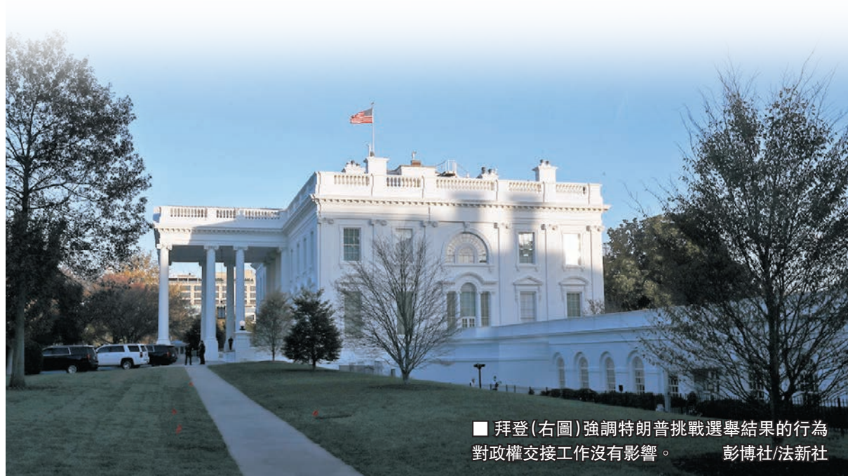
拜登(右圖)強調特朗普挑戰選舉結果的行為對政權交接工作沒有影響。