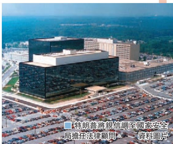
特朗普將親信調至國家安全局擔任法律顧問。資料圖片